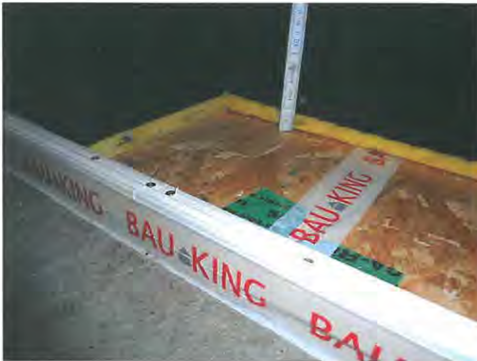
Abbildung 1: Aufbau der Unterkonstruktion

Die Proben wurden auf einer Unterkonstruktion eingespannt. Die Unterkonstruktion bestand aus 18 mm starken OSB-Platten, die auf der gesamten Prüffläche bündig auf den Hallraumboden gelegt wurden. Auf den OSB-Platten wurde der Rahmen befestigt, auf den die Klemmschienen geschraubt wurden. Nachfolgende Abbildung 1 zeigt beispielhaft den Aufbau der Unterkonstruktion.